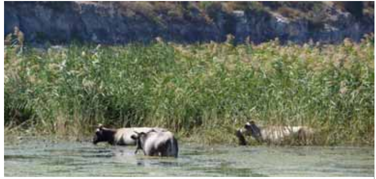
Halbwilde Prespa-Rinder in Psarades im „Naturschutz-Einsatz“ bei der Schilf-Weide im Ried

tifizierung der Tiere sehr schwierig. Die Rinder werden halbwild und fast ganzjährig draussen gehalten. Zur Fleischnutzung müssen sie oft geschossen werden. Zuerst mussten die reinen Tiere identifiziert und dann die zugehörigen Besitzer ermittelt werden, ein grosser Aufwand, der mehrere Wochen in Anspruch nahm und nur dank dem engagiertem Einsatz lokaler Helfer durchgeführt werden konnte. Im Gegensatz dazu konnten in LehoVo die Tiere auf dem Hof besichtigt und die reinen Tiere ausgelesen und angekauft werden. Inzwischen wurden mit Hilfe der Society for the Protection of Prespa und dem griechischen SAVE Partner Amaltheia zwei Zuchtgruppen, eine im Dorf Lemos, eine andere auf der Insel Agios Achillios aufgebaut.