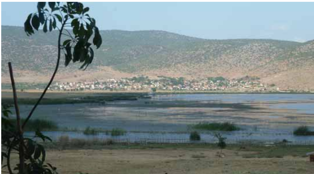
Landschaft und Vegetation am albanischen Ufer des grossen Prespa-Sees

Im Rahmen des Langfristmonitorings in der Balkanregion konnten vergessen geglaubte oder unbekannte Nutzierrassen wieder entdeckt werden. Am Anfang stand die Recherche: Literaturstudium, Berichte, Kartenmaterial. Berichten zufolge soll es im Gebiet der Prespa-Seen vereinzelt ausgesprochen kleine Rinder geben oder gegeben haben, die wie Ziegen in den Bergen herumklettern. Diesem Prespa Rind ist SAVE Foundation seit Frühjahr 2006 auf der Spur. Damals gingen Vertreter der Stiftung den Hinweisen auf das Zwergrind an dem auf drei Staaten aufgeteilten Prespa-See nach. Dieses Grenzgebiet war bis Ende der 1990er Jahre militärisch gesperrt. Es gehört zu Albanien, Griechenland und FYR Mazedonien. Die Suchtour brachte die Identifizierung und das Aufzeigen möglicher Erhaltungsmaßnahmen für dieses im Bestand gefährdete Rind ( www.save-foundation.net/deutsch/PDF/Prespa_Rind.pdf ), das heute nur noch in Albanien in nennenswerter Zahl vorkommt. Festgestellt wurde eine bereits stark zunehmende Verkreuzung der Zwergrinder mit ausländischen Leistungsrassen.